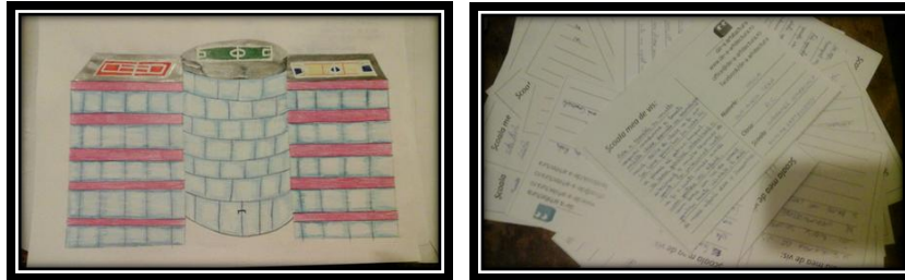
Școala mea de vis - pe cartolinele realizate de elevi după prima ședință

„Școala mea de vis se află într-o poeniță la marginea unei păduri, asemenea unui castel, cu terenuri mari de sport.”